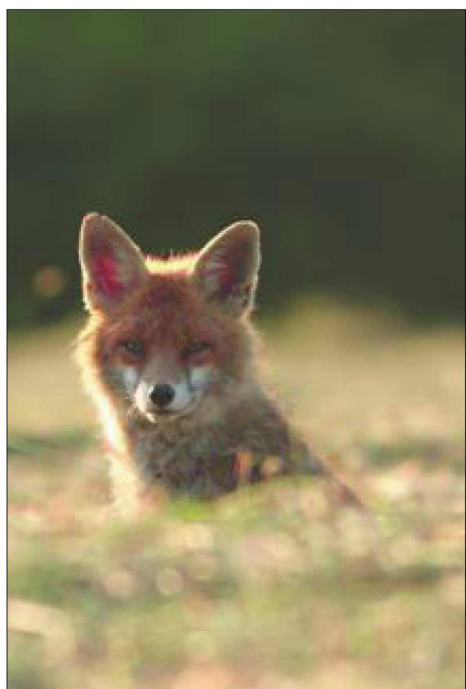
« Échange de regards » avec un renard.

À voir, le site internet d'Hervé Oberlender : www.rvo-photos.fr